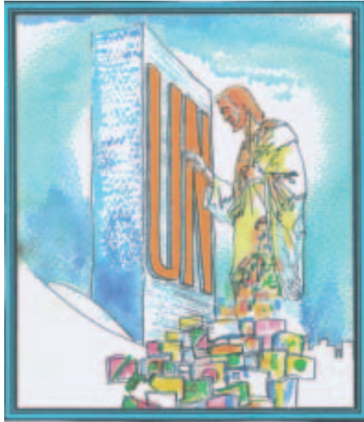
FN bygningen i New York

I den stille klare morgen, som når dagen travlest er, og ved soleglad med kveldens milde vind. I den tause midnattstime, og ved månens bleke skjær. Jeg vil lytte etter lyden av hans trinn.